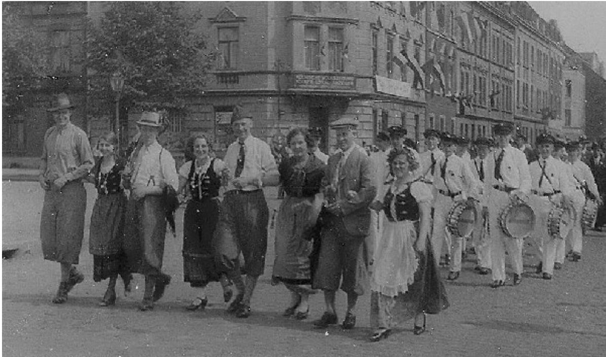
(Schützelfest in Humboldt-Gremberg)

Die ersten Schützenumzüge, an denen der THC zur Freude der Bevölkerung aufspielte, waren die der Schützengesellschaft Humboldt-Gremberg 1921 e.V., St. Hubertus Schützen Kalk und der St. Sebastianus Schützenbruderschaft Deutz e.V.