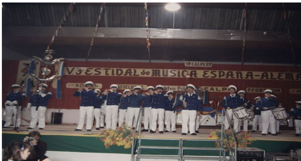
(1989 in Calpe / Spanien)