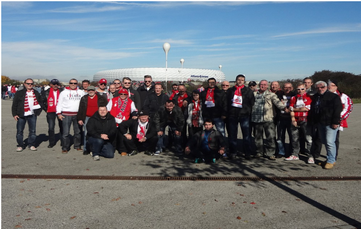
(Allianz Arena München)