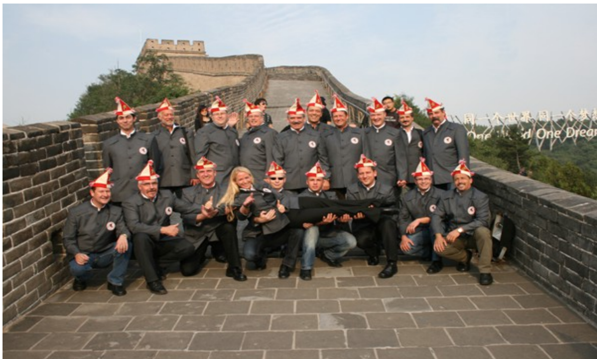
(auf der Chinesische Mauer bei Peking)