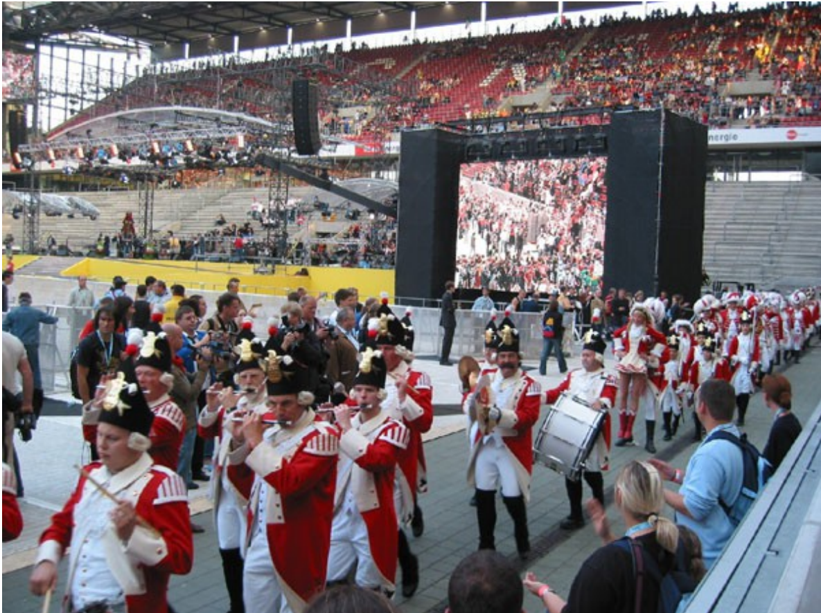
(2005 Weltjugendtag im Rheinenergiestadion)

Am 18.08.2005 wird uns eine neue Ehre zuteil. Gemeinsam mit den Kölschen Funken rut-wieß vun 1823 e.V. ziehen wir am Weltjugendtag ins Kölner Rheinenergiestadion vor über 30.000 Menschen ein, um die Ankunft des Papstes zu feiern.