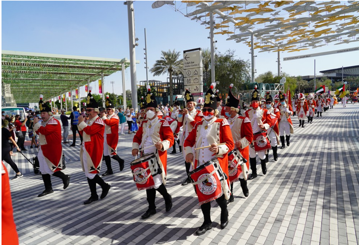
(Aufzug auf der EXPO in Dubai)

Vor dem deutschen Pavillon hatten sich Schlangen von 1 h Dauer gebildet. Wir vertrieben den Wartenden die Zeit mit Aufführungen, in welche die internationalen Besucher jedweder Hautfarbe aus der ganzen Welt mit einbezogen wurden.