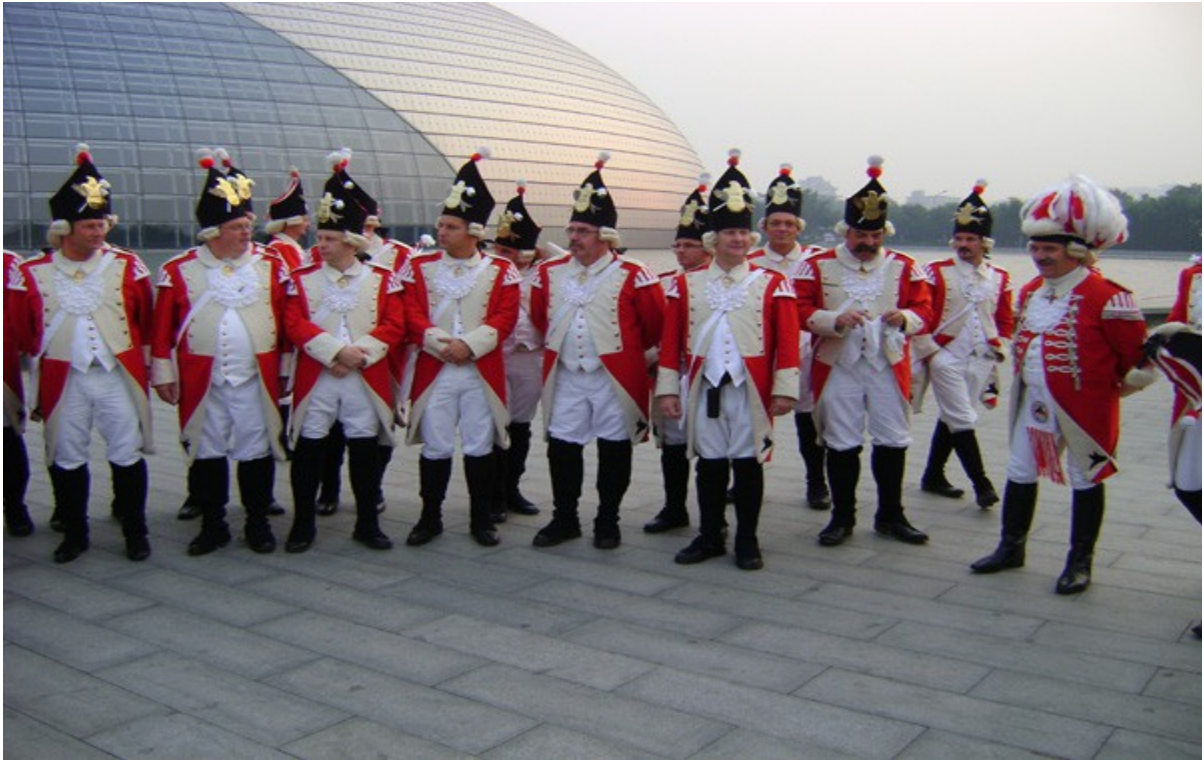
(vor dem Grand National Theater Peking)

Dort hatten wir einen gemeinsamen großen Auftritt als Vertreter der Stadt Köln vor Persönlichkeiten aus Politik und Wirtschaft sowie hohen chinesischen Würdenträger im Grand National Theater. Der krönende Abschluss in Peking war unser Auftritt in roter Uniform und das Galaessen auf der chinesischen Mauer am „Yu Yong Pass“ mit einem anschließenden Live-Konzert der Hühner. Das hatte es noch nie zuvor in China gegeben. Zwecks Erholung von den Strapazen führte uns die nächste Etappe für ein paar Tage auf die chinesische Insel Hainan nach Sanya. Dort ließen wir uns nach allen Regeln der Kunst verwöhnen und gaben unser inzwischen berühmt gewordenes „Strandkonzert“ zum Besten. Wir sagen an dieser Stelle den Roten Funken danke für diese schöne und unvergessene Reise.